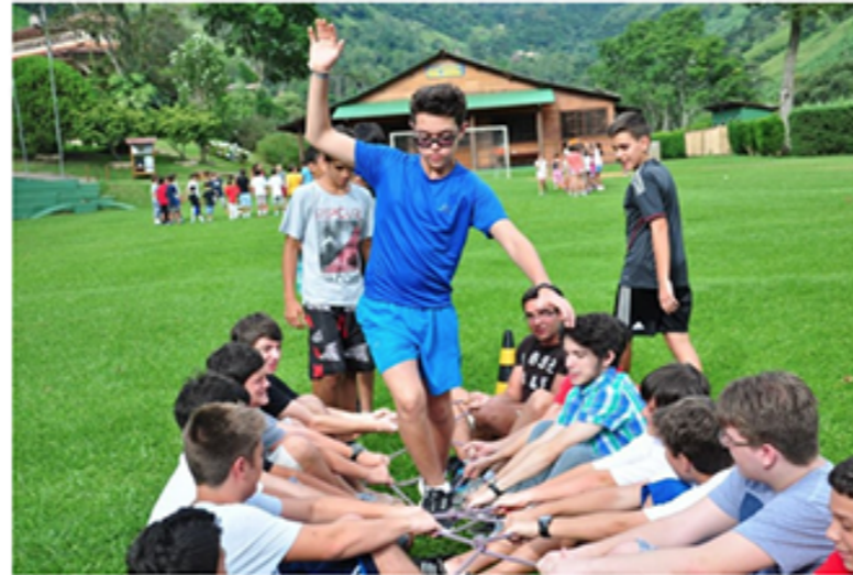
Pais em Apuros – Espírito de equipe, valor guia de todos acampamentos.